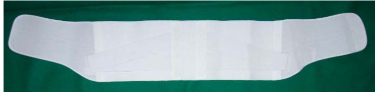
▲ウエストサポートデラックス (保温タイプ)