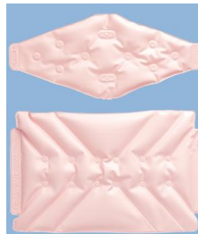
上:ホットパック-C 下:ホットパック-L